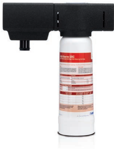
BWT AQA THERM HWG

Mit Hilfe der perfekt aufeinander abgestimmten AQA therm-Produkte wird das Füll- und Ergänzungswasser für Ihre Heizungsanlage perfekt aufbereitet – ganz ohne Zusatzstoffe nach dem BWT ReinHEIZgebot. So sparen Sie Heizkosten und sorgen für einen effizienten Betrieb Ihrer Heizung über Jahrzehnte hinweg.